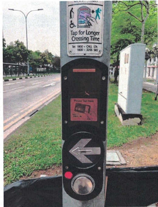
cartão para deficientes usarem nas faixas de pedestres