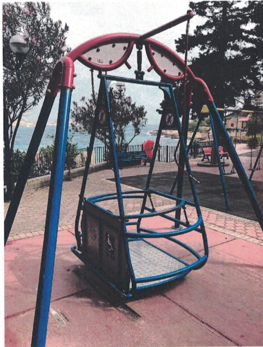
Cabines adaptadas em brinquedos